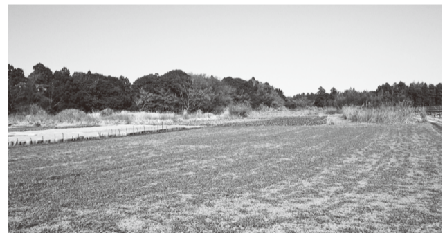
建設候補地として選定された吉田地区