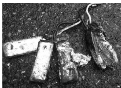
実際にリサイクル施設で発火したリチウムイオン電池