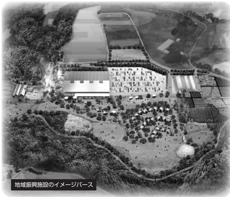
地域振興施設のイメージパース

その後、令和8年度に工事着手し、次期中間処理施設との同時オープン（令和10年度中）を予定しています。