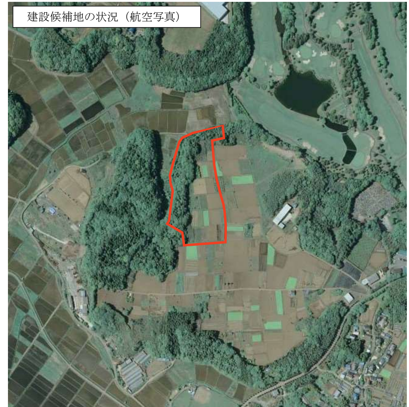
(平成 20 年 5 月 6 日撮影)