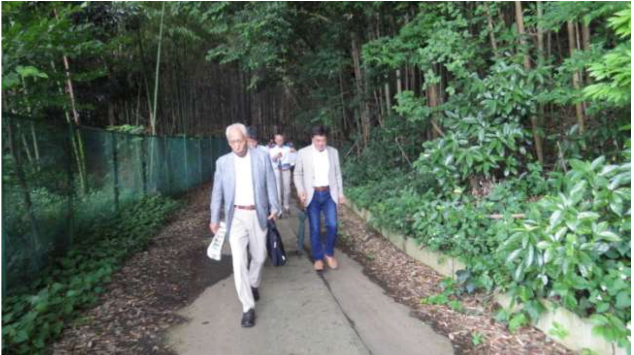
建設候補地東側に位置する周辺施設（泉カントリー倶楽部）や斜面林を確認しながら、北側の谷津田に向かう施設整備基本計画検討委員