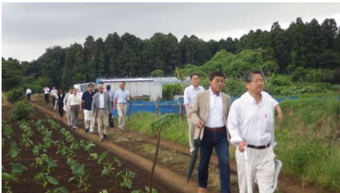
建設候補地の南側から現地調査に向かう施設整備検討委員