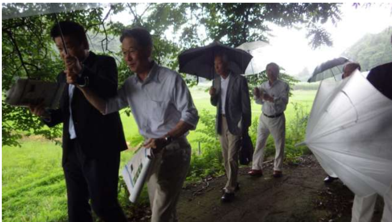
建設候補地北側の谷津田や周辺の斜面林を確認する施設整備基本計画検討委員