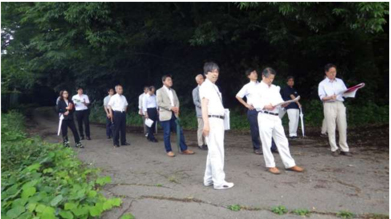
建設候補地北東側から谷津田を確認する施設整備基本計画検討委員