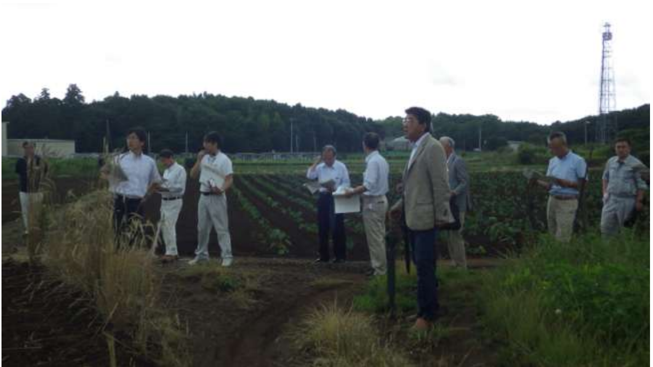
建設候補地南側の敷地境界から現地を確認する施設整備基本計画検討委員