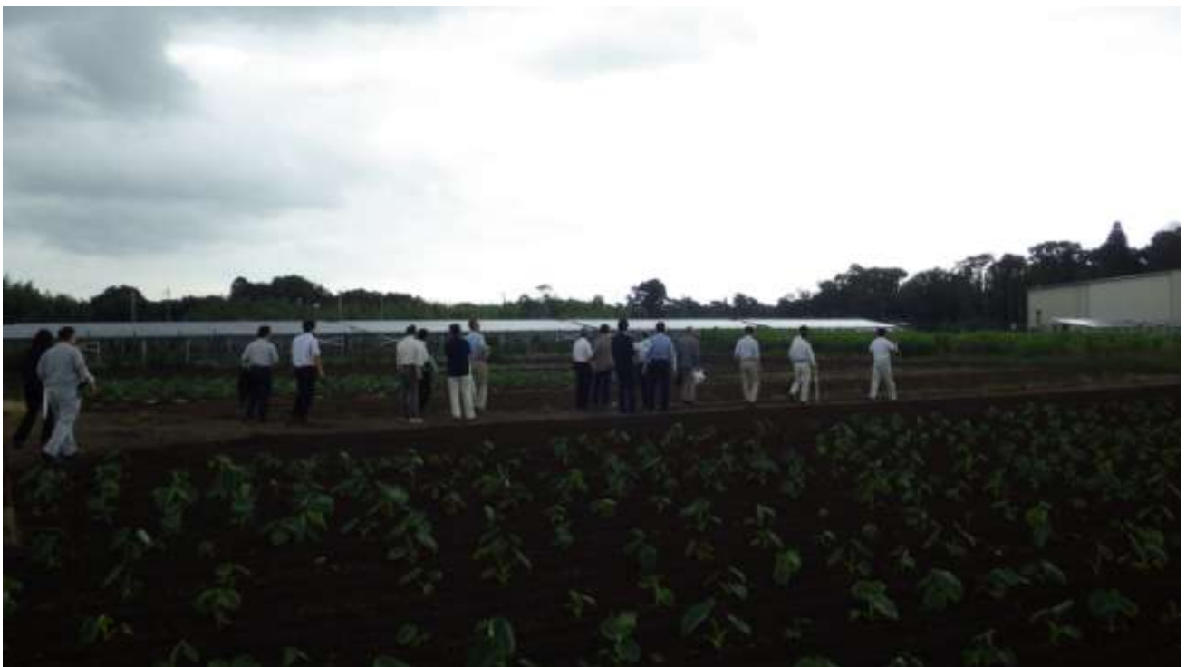
建設候補地東側に隣接する周辺状況を確認する施設整備基本計画検討委員