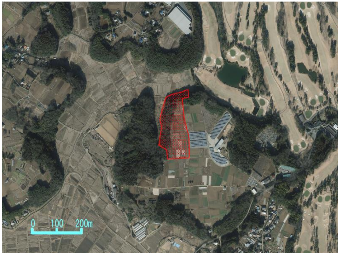
図 1-4-1 建設候補地の位置