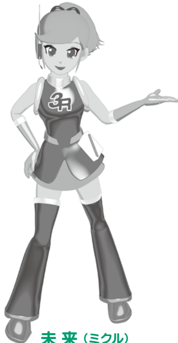
未来 (ミクル) 印西クリーンセンター 3Rイメージキャラクター