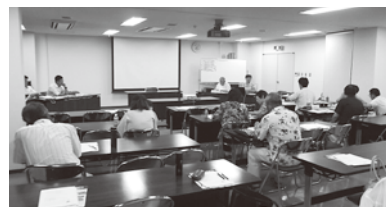
第1回講習会の様子

印西市、白井市、栄町で活動する市民 団体と関係市町が協働して、ごみ減量を 推進するための「印西地区ごみ減量推進 連絡会(事務局:印西クリーンセンター)」 による、本年度第2回目「ごみ減量・分 別講習会」の開催を予定しています。