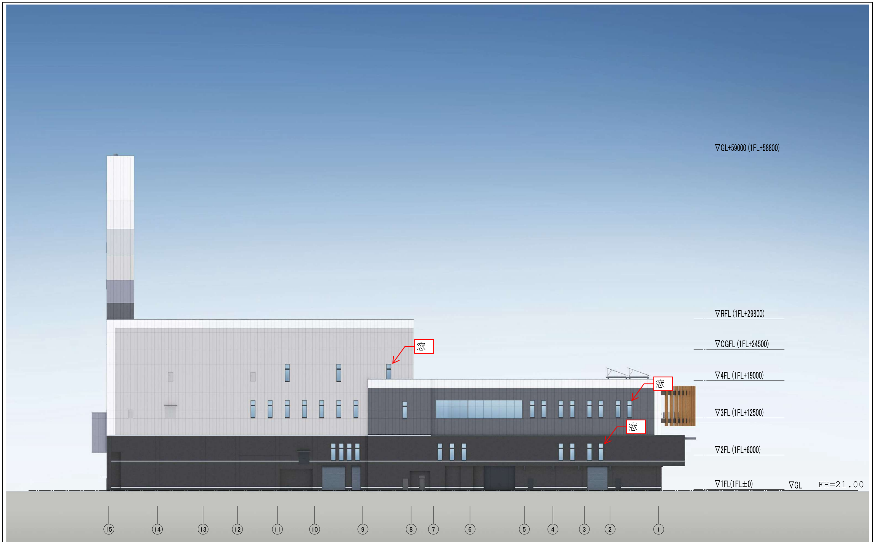
3. 図面 (本施設) (2)施設立面図 (西) A1=1:200 A3=1:400