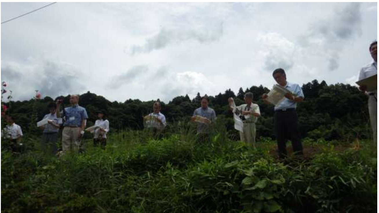
建設候補地北西側から印西市の計画幹線道路【（仮称）松崎・吉田線】を確認する地域振興策検討委員