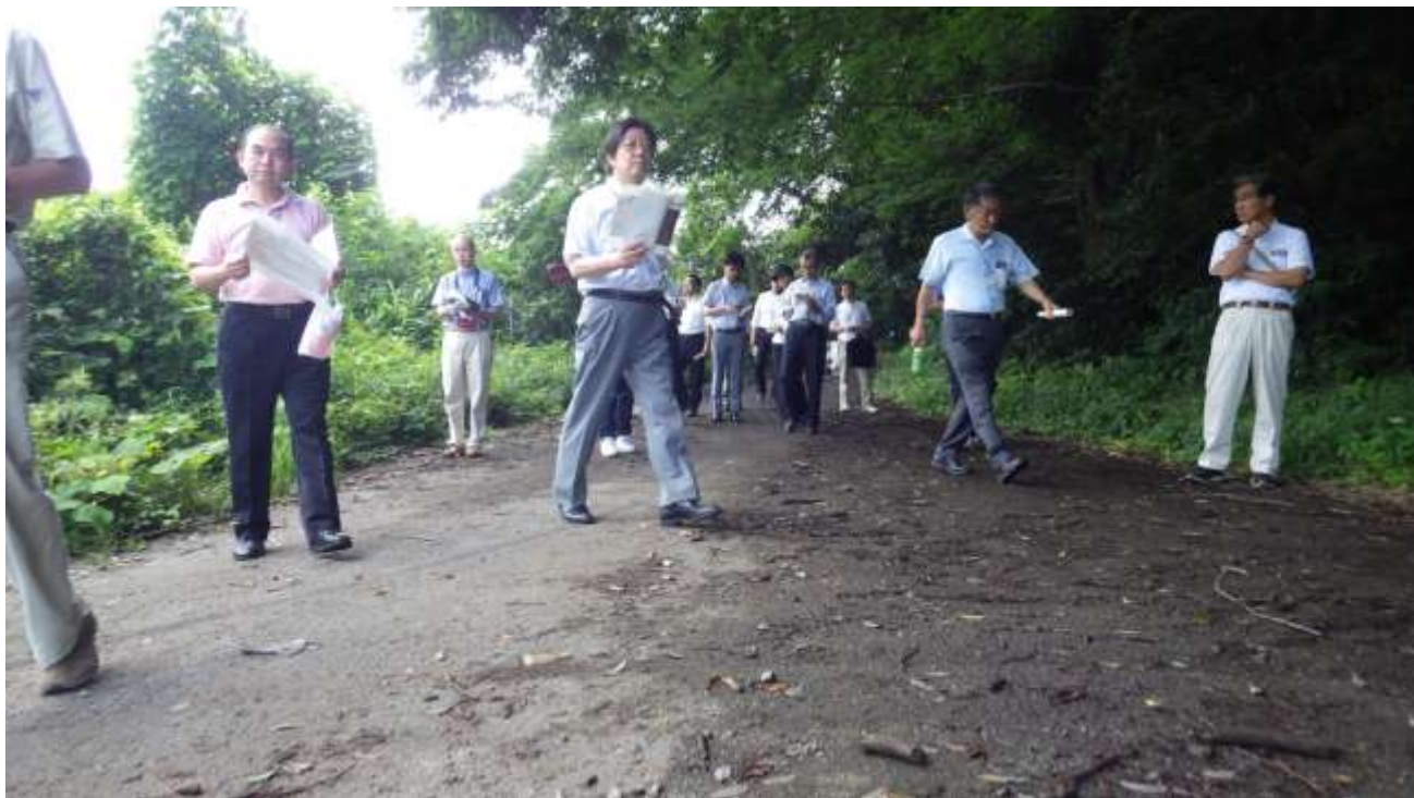
建設候補地北東側から周辺施設（泉カントリー倶楽部）や谷津田を確認する 地域振興策検討委員