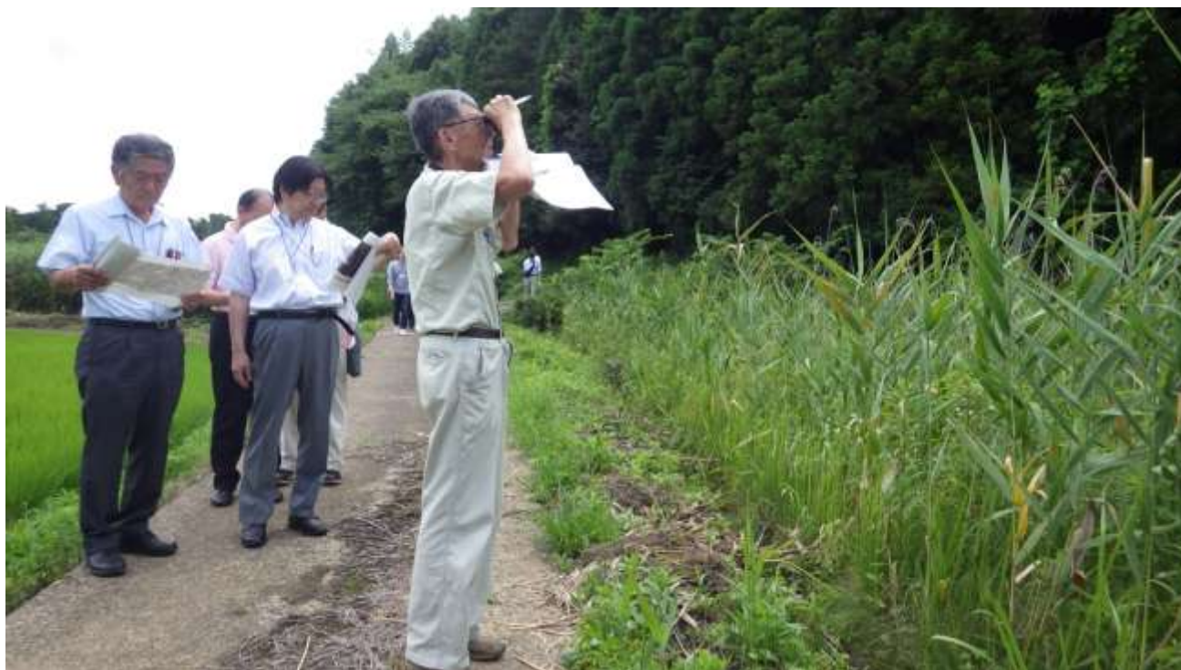
建設候補地西側の谷津田や猛禽類の飛翔が確認されている対岸の斜面林を 確認する地域振興策検討委員